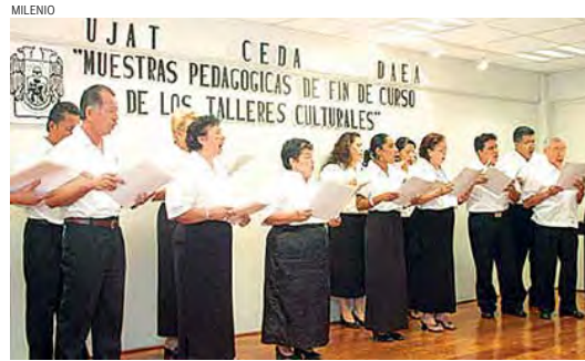
El Coro Universitario Antonio Vivaldi interpretó clásicos y temas populares mexicanos.

Redacción Campus suplemento@campusmilenio.com.mx @yahoo.com.mx